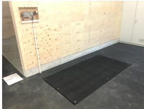
[埋込み式の場合の設置例]