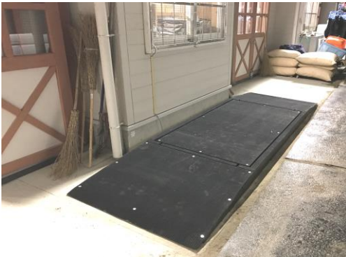
[移動式の場合の設置例]