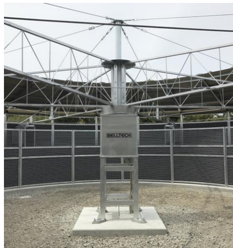
【 本体機械部 】