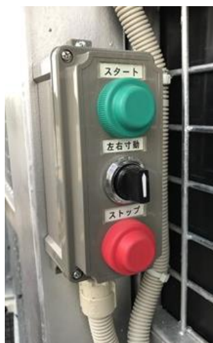
【 リモコン 】