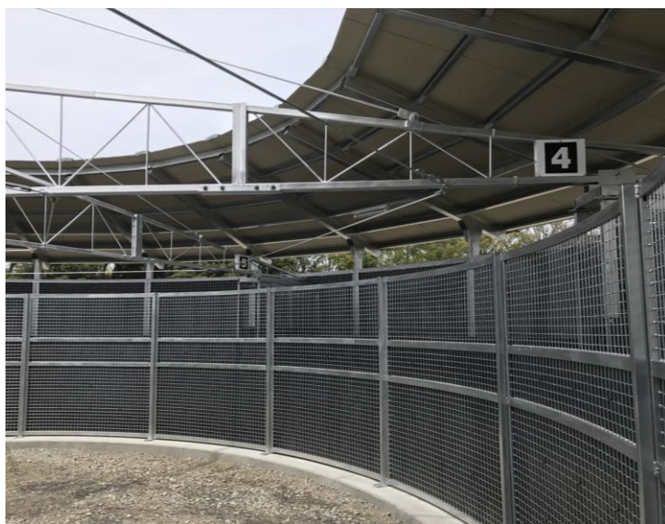
【 内周ネット 】