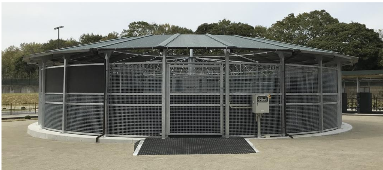
【 屋根付ウォーキングマシン全景・外周 】