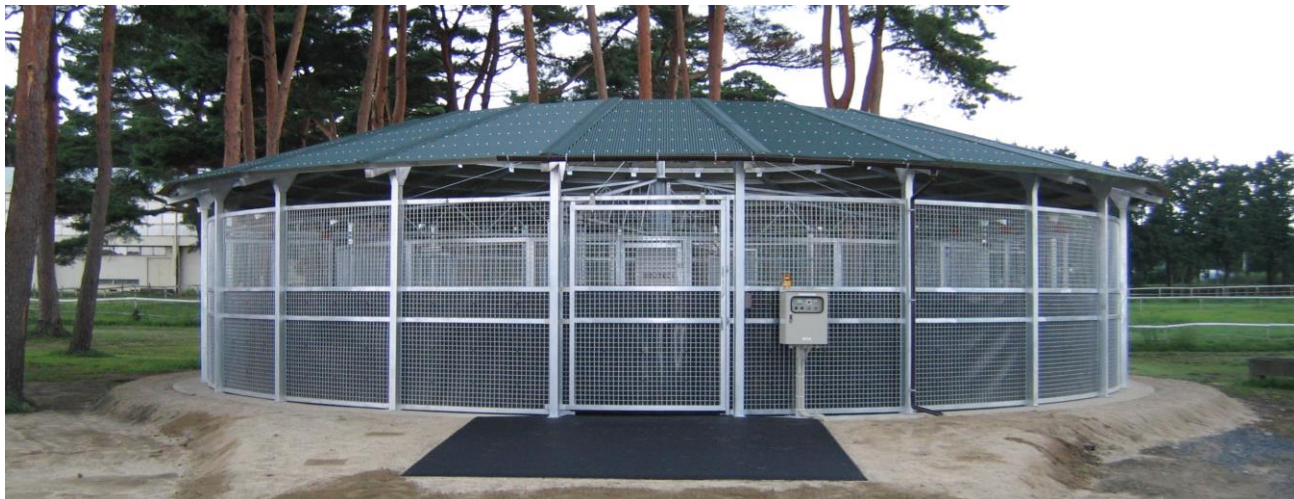
[ 屋根付ウォーキングマシン設置例 (直径15m) ]

競走馬の生産・育成・トレーニング等において、当該製品の必要性は周知の通りでございます。弊社は、競走馬関連・開発機器メーカーとして、長年の経験と確かな技術、様々なお客様のご要望を取り入れて、競走馬に関する機器を開発しており、関係官庁を始め、全国の牧場でご好評頂いております。