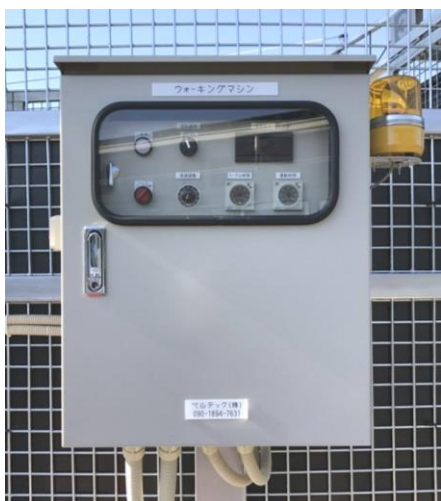
【 操作盤 】